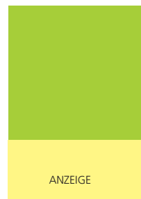
210 x 100 mm 2 2