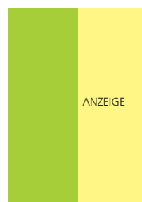
98 x 297 mm 2 3