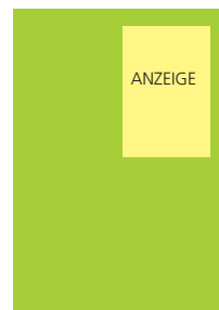
85 x 127 mm 2 1