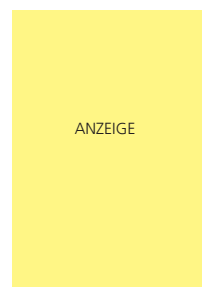
210 x 297 mm 2 5