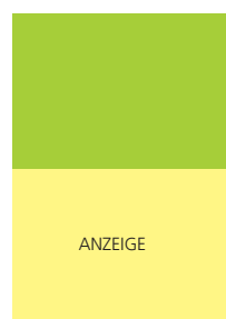
210 x 145 mm 2 4