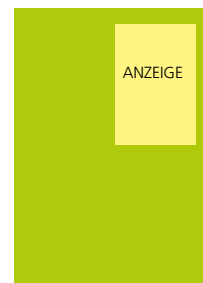
85 x 127 mm 2 1