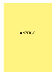
210 x 297 mm 2 5

Im Preis enthalten: 50 Exemplare des Leitfadens zur Verteilung an eigene Kontakte bzw. Kunden. Zusendung kostenlos nach Erscheinen.