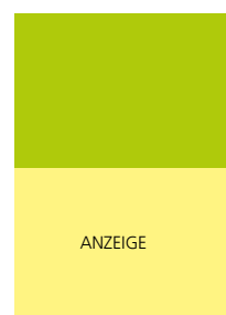
210 x 145 mm 2 4