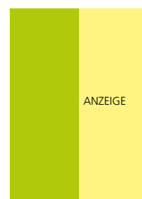
98 x 297 mm 2 3