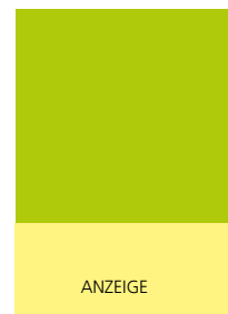
210 x 100 mm 2 2